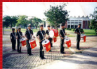
ชมรมดุริยางค์