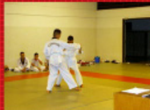
ชมรมเทควันโด