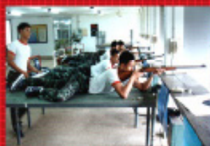
ชมรมยิงปืน