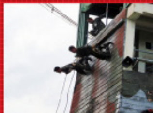
ชมรมตรีเพชร