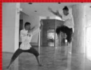
ชมรมมวยไทย